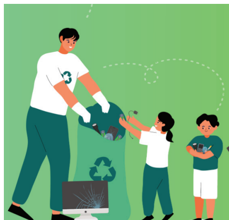
Relacje z wydarzeń na profilu @Love Recykling

Coraz większych rumieńców nabiera konkurs szkolny „Elektrośmieci oddajesz – nagrody dostajesz”. Setki szkół zbierają elektrośmieci, zgłaszają odbiory i rywalizują o nagrody ogólnopolskie i wojewódzkie. Do konkursu można przystąpić jeszcze do końca czerwca, a następnie oddać zużyty sprzęt oraz odebrać nagrody. Każda placówka zdobywa punkty za każdy kilogram przekazanych odpadów. Punkty można zamienić na pomoce szkolne. Szkoła, która przekaze najwięcej sprzętu, wygrywa dodatkową nagrodę o wartości 7 tys. zł.